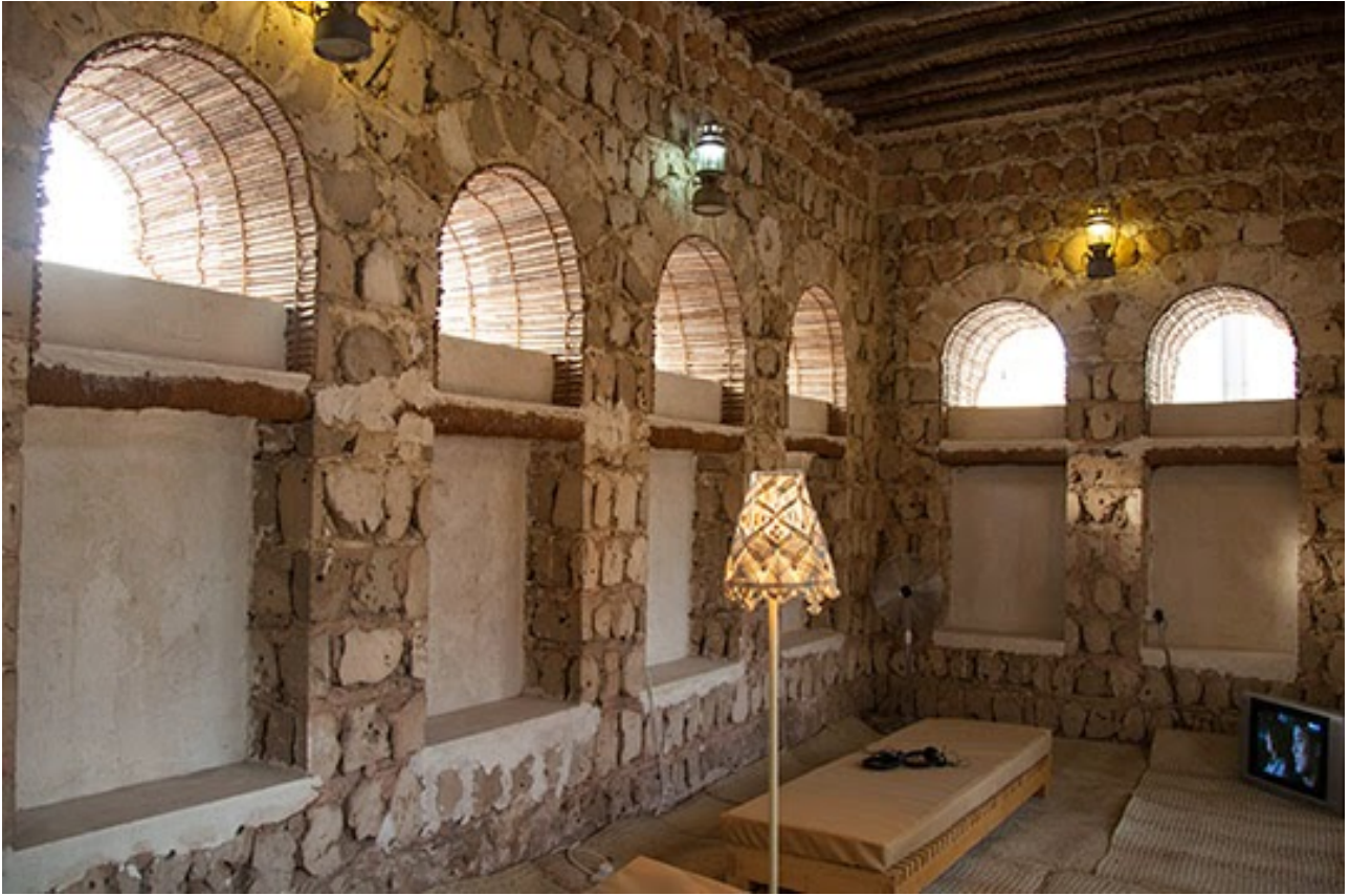
Haegue Yang, An Opaque Wind , 2015. Mixed-media installation. Commissioned by Sharjah Art Foundation. Courtesy Galerie Chantal Crousel, Paris; Greene Naftali, New York; Kukje Gallery, Seoul; Galerie Wien Lukatsch, Berlin; and the artist. Installation view, Sharjah Biennial 12 Image courtesy of Sharjah Art Foundation. Photo by Deema Shahin

Este sitio utiliza cookies de Google para prestar sus servicios y para analizar su tráfico. Tu dirección IP y user-agent se comparten con Google, junto con las métricas de rendimiento y de seguridad, para garantizar la calidad del servicio, generar estadísticas de uso y detectar y solucionar abusos.