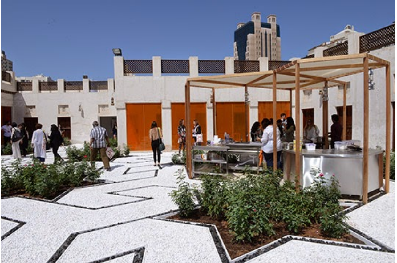
Rirkrit Tiravanija, untitled 2015 (Eau de Rose of Damascus) . Mixed-media installation. Commissioned by Sharjah Art Foundation. Courtesy of the artist. Installation view, Sharjah Biennial 12. Image courtesy of Sharjah Art Foundation. Photo by Shanavas Jamaluddin