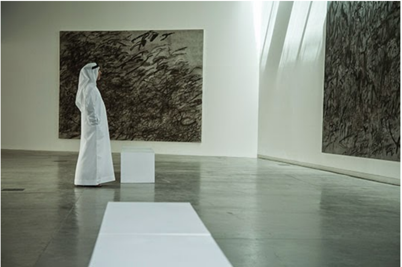
Julie Mehretu, Works from the series Invisible Sun , 2014–15. Collection of Louisiana Museum of Modern Art, Humlebaek, Denmark and private collection Courtesy carlier|gebauer gallery, Berlin; Marian Goodman Gallery, New York; and the artist. Installation view, Sharjah Biennial 12.