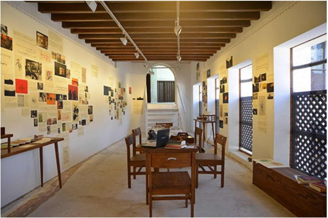
Basel Abbas and Ruanne Abou-Rahme, The Incidental Insurgents (Parts 1–3) , 2012–15. Mixed-media installation, Partial commission by Sharjah Art Foundation. Courtesy Carroll/Fletcher, London, and the artists. Installation view, Sharjah Biennial 12. Image courtesy of Sharjah Art Foundation.