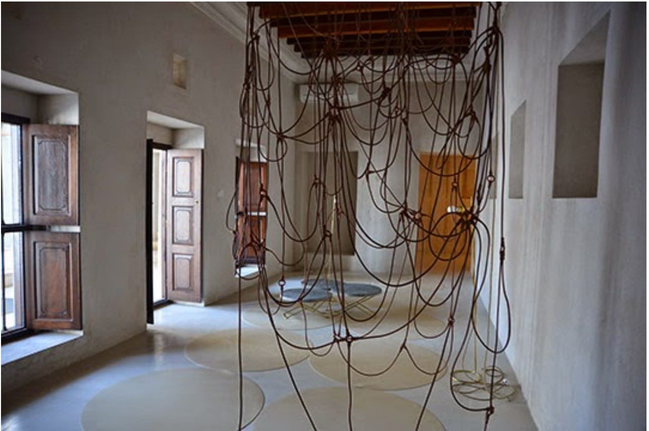
Leonor Antunes, The Unpredictability of Possible Future Uses , 2015. Leather, hemp, brass, steel, electrical cables, lamps, concrete and teak. Commissioned by Sharjah Art Foundation. Courtesy of the artist. Installation view, Sharjah Biennial 12. Image courtesy of Sharjah Art Foundation.