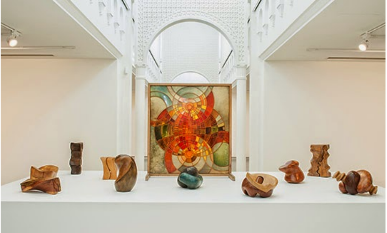
Saloua Raouda Choucair, various works. Courtesy Saloua Raouda Choucair Foundation. Installation view, Sharjah Biennial 12. Image courtesy of Sharjah Art Foundation. Photo by Alfredo Rubio