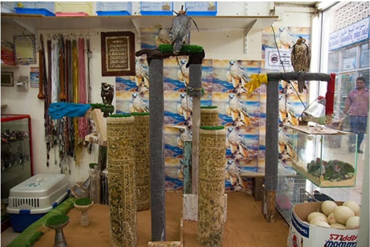
Abraham Cruzvillegas, Reconstrucción2: Here we stand , 2015. Installation at the Animal and Bird Market in Sharjah. Commissioned by Sharjah Art Foundation.