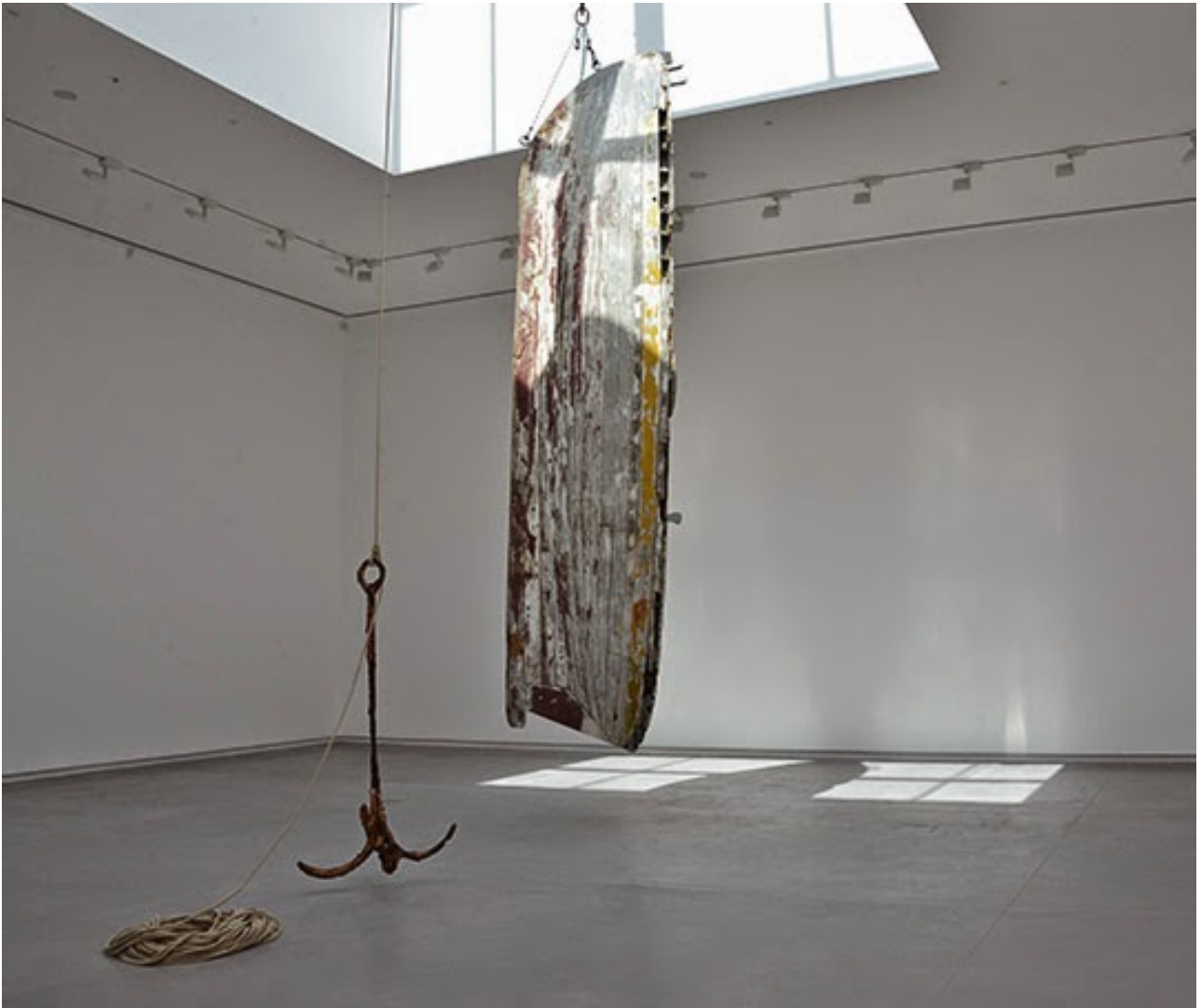
Rayyane Tabet, Cyprus , 2015. Wooden boat, steel anchor, pulleys, rope and hardware. Commissioned by Sharjah Art Foundation. Courtesy Sfeir-Semler Gallery, Beirut and Hamburg, and the artist. Installation view, Sharjah Biennial 12.

Este sitio utiliza cookies de Google para prestar sus servicios y para analizar su tráfico. Tu dirección IP y user-agent se comparten con Google, junto con las métricas de rendimiento y de seguridad, para garantizar la calidad del servicio, generar estadísticas de uso y detectar y solucionar abusos.