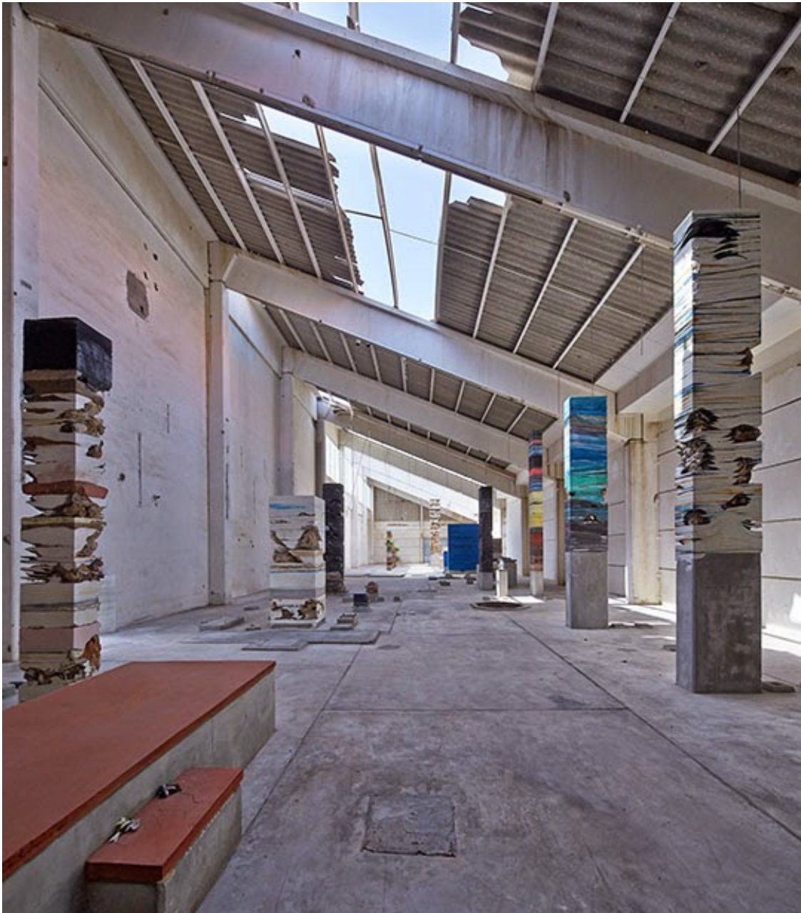
Adrián Villar Rojas. Planetarium , 2015. Site-specific installation. Commissioned by Sharjah Art Foundation. Courtesy kurimanzutto, Mexico City; Marian Goodman Gallery, New York; and the artist. Kalba Ice Factory, Sharjah Biennial 12. Photo: Jörg Baumann. © 2015 baumann fotografie frankfurt a.m.