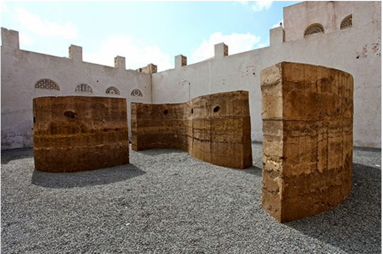
Damián Ortega, Talking Wall , 2015. Wooden cast, clay, sand, gravel, hay, rocks, Styrofoam ear pieces and flexible PVC pipes. Dimensions variable. Commissioned by Sharjah Art Foundation. Courtesy kurimanzutto, Mexico City and the artist. Installation view, Sharjah Biennial 12.