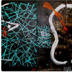
El caos en el cosmos de Antón Patiño