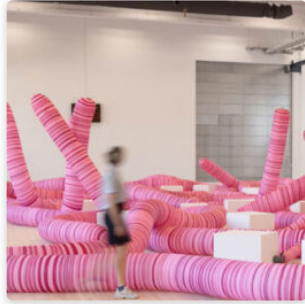
Los gusanos de Shrigley