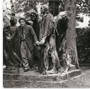
Las visitas guiadas regresan a la muestra sobre Rodin y Giacometti en la Fundación MAPFRE