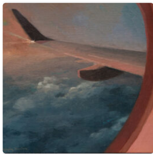
Oyágüez Montero, un viaje de 50 años